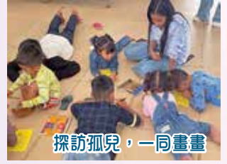
探訪孤兒，一同畫畫