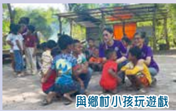
與鄉村小孩玩遊戲