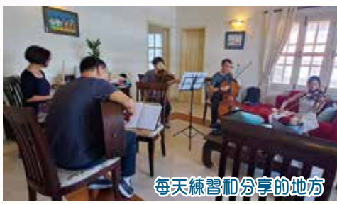
每天練習和分享的地方