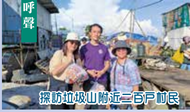
探訪垃圾山附近二百戶村民