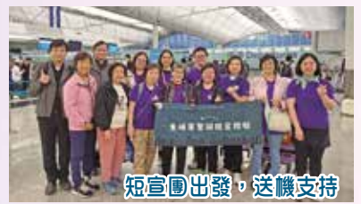
短宣團出發，送機支持