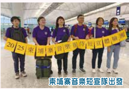
柬埔寨音樂短宣隊出發