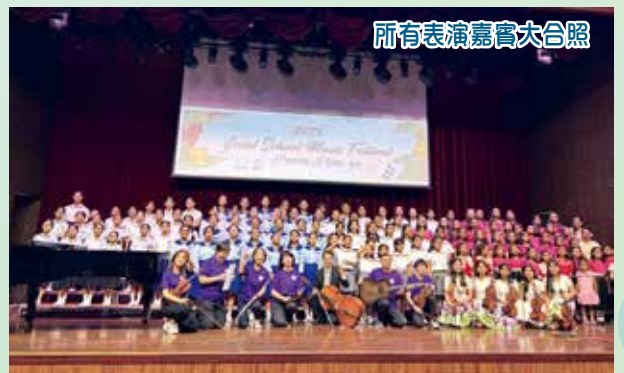
所有表演嘉賓大合照