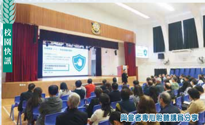
與會者專心聆聽講員分享