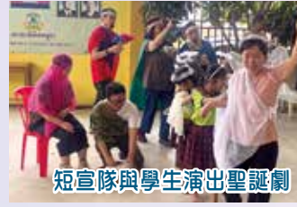
短宣隊與學生演出聖誕劇