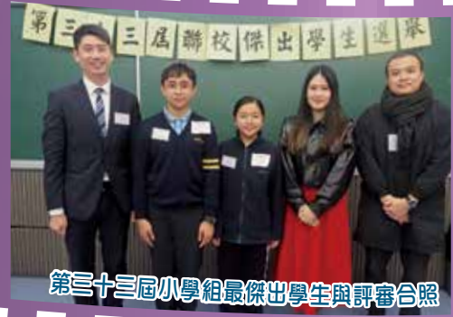
第三十三屆小學組最傑出學生與評審合照