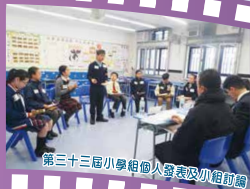
第三十三屆小學組個人發表及小組討論