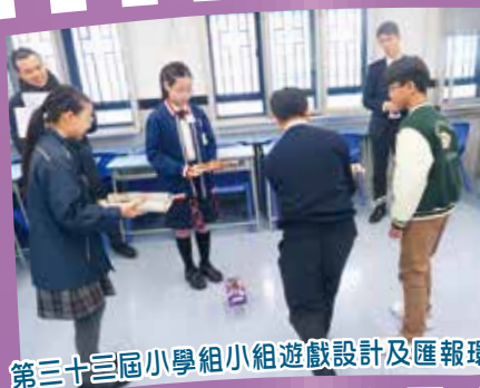
第三十三屆小學組小組遊戲設計及匯報環節