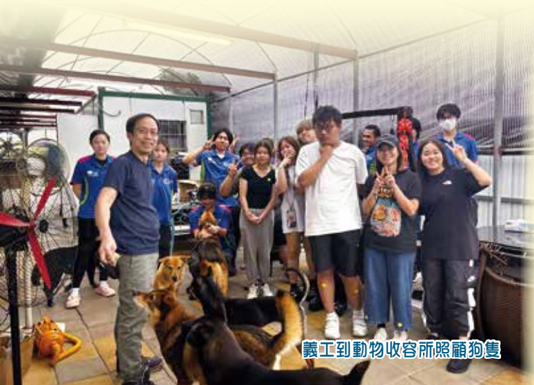
義工到動物收容所照顧狗隻