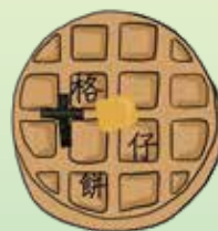
「格仔餅」網絡媒體的標誌