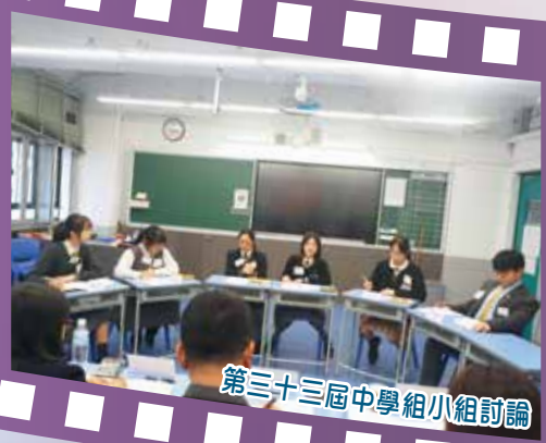
第三十三屆中學組小組討論