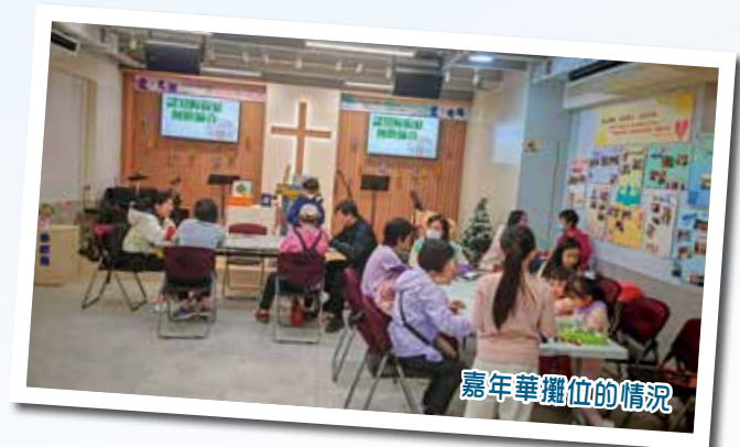
嘉年華攤位的情況