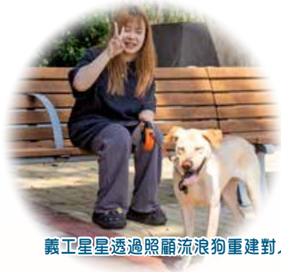
義工星星透過照顧流浪狗重建對人的信任