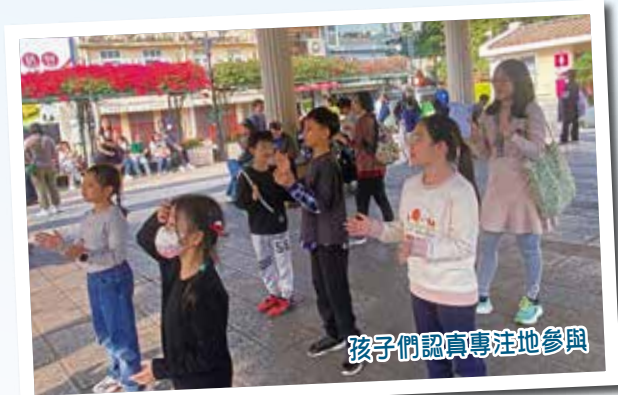
孩子們認真專注地參與

這次旅程中，我感受到澳門人生活簡樸，友善和有人情味的一面。與其中一位長者傾談，深深體會到他們到了年華老去的時候，已覺得人生毫無意義，也沒有動力去活著。盼望主恩臨到澳門人的心，使他們體會到主耶穌基督復活的大能和盼望。 ELCHK