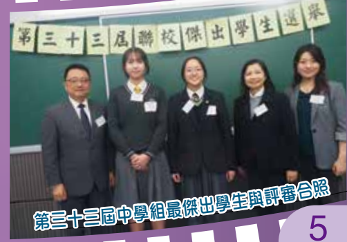
第三十三屆中學組最傑出學生與評審合照