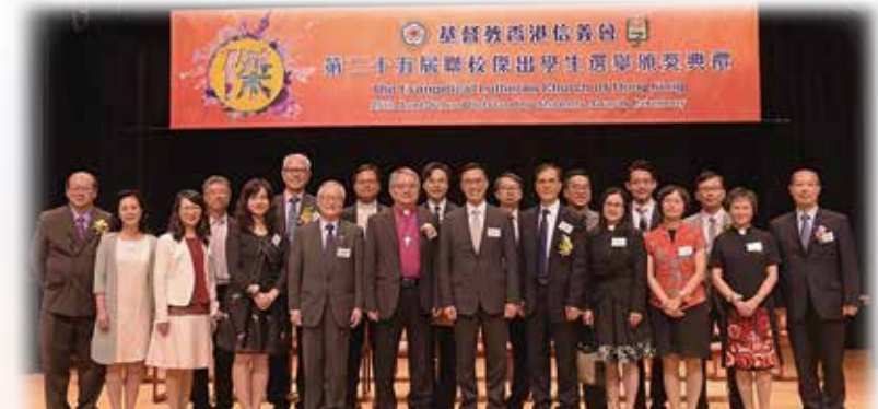
第二十五屆傑生頒獎典禮，主禮嘉賓為時任教育局楊潤雄局長（前排右六）。

擔任評判，就各候選人呈交的書面履歷及校內外成績評分；次輪則邀請教育界資深同工或社會賢達擔任評判，就候選人現場的表現評分。兩次評分總和最高分者將獲選為「最傑出學生」。由於兩輪評審需時頗長，也涉及大量人手，學校教育部及校長們在仔細研究數據後，發覺兩輪評審所得分數的相關性（correlation）其實相當高，因此決定只保留現場評審這一輪；而其中「自我介紹」的環節則由原本不計分改為計分。至於獲獎人數，早期中小學兩組各設一名「最傑出學生」，評判團鑑於候選人水平很高，曾多次建議增加獲獎人數。二零二三年學校教育部決定把每組得獎人數增至兩人，即每年共有四位「最傑出學生」。