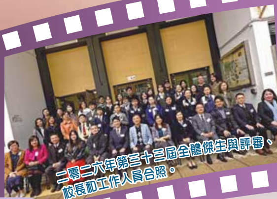
二零二六年第三十三屆全體傑出學生與評審、校長和工作人員合照。

評審細則曾經歷兩次比較大的改變，一次涉及評審程序，另一次則涉及獲獎人數。首先是程序，早期評審工作共分兩輪，首輪由本會常委或教牧代表