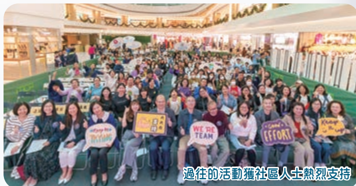
過往的活動獲社區人士熱烈支持