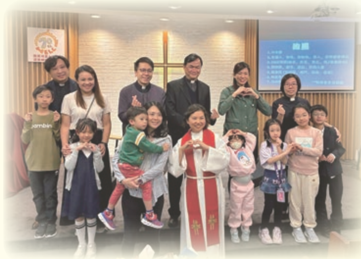
二零二五澳門聖誕親子短宣差遣