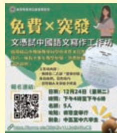
「自修空間」活動海報