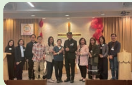
「聊舒角」在二零二五年一月二十四日舉行開幕典禮，當日譚有志監督、本會前任及現任社會服務部總幹事，及十多個社區友好團體到場祝賀及支持。