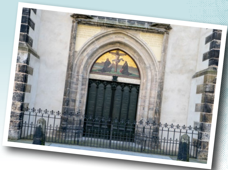
路德在威登堡的教堂門外釘上《九十五條論綱》，成為教會改革運動的關鍵里程碑。

捍衛聖經的信息，其捍衛的意思，就是不應該按教宗或當時教會想要達到的一些目的，就在教導聖經的內容時，加上一些條件或詮釋，這是路德提出《九十五條論綱》，想與別人一起辯論時最基本的思路。