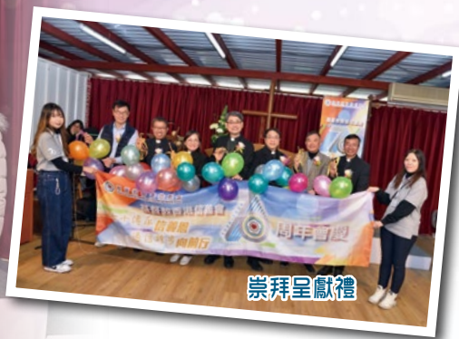
七十周年會慶籌委合照