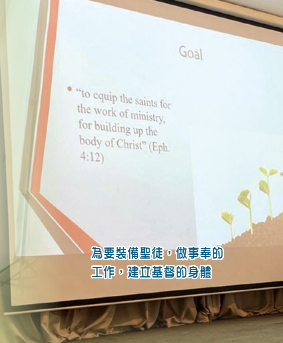
為要裝備聖徒，做事奉的工作，建立基督的身體