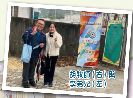
胡牧師（右）與李弟兄（左）