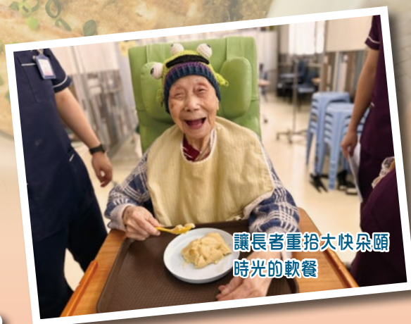
讓長者重拾大快朵頤時光的軟餐