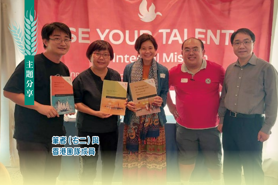
筆者(右二)與香港團隊成員