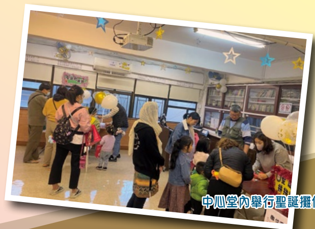
中心堂內舉行聖誕攤位

願上帝繼續使用中心堂，善用祂給我們的才幹、恩賜及社區資源去祝福社區，傳揚福音。亦鼓勵各堂會的弟兄姊妹，好好善用上帝所給我們的，在身處的社區榮耀祂的名。 ELCHK