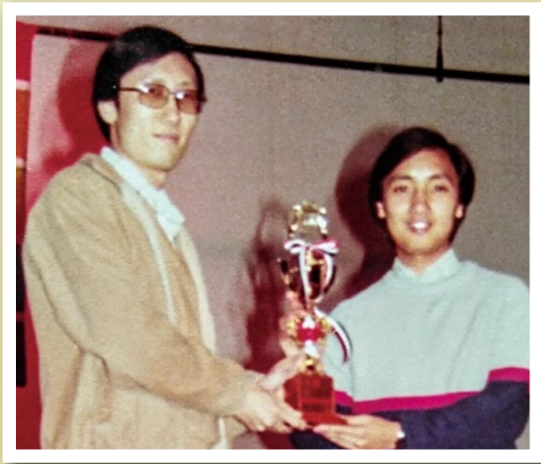
傅弟兄（左一）在青年團契聯會新界東區活動（一九八二年十二月）頒獎。

傅弟兄亦曾在事奉中經歷挫折，在他二十歲初於堂會教小學生主日學時，適逢處於屬靈低潮，於兒童主日學中「Hea」教，只當完成工作罷了，對小朋友的態度也不專心。但是，上帝就藉兒童主日學導師訓練課程，提醒他事奉要認真，不要怕辛苦和麻煩，再次點燃他事主的心志，重新對焦，上課只是途徑，學員及自己的靈命（教學相長）才是目的。他在挫折中成長和振作，不再錯過上帝日後安排的每個機會，忠主所託。