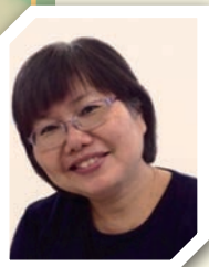
■ 卜海崙姊妹 救恩堂

先賢此刻相伴，我們感恩： 監督教牧指引方向；總辦事處堅強後援；人事策劃帶來革新；傳道牧養更新教會；學校教育愛心為本；信徒培育生命甦醒；青少年活出召命；家庭關顧信仰在家；社會服務播種希望；海外宣教擴展天國；大眾傳播為道發聲。 謝謝主，給我們基督教香港信義會！