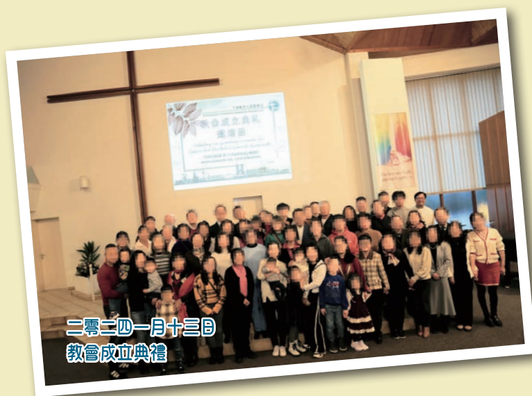
二零二四一月十三日 教會成立典禮