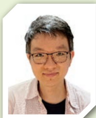
■老樂華部長 活靈堂

無論今日本會的光景是如何，希望你們能夠持守信義人的心，信靠上帝的應許，憑著對上帝的信心跨越面前一個又一個的挑戰，在社會中作鹽作光。作為大眾傳播部和學校教育部的成員，勉勵你們在常委的崗位上，努力促進信義會為道發聲、服務社區的角色。