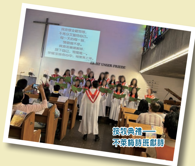
按牧典禮—— 不萊梅詩班獻詩