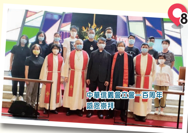
中華信義會立會一百周年 感恩崇拜

這篇分享文章的內容不是工作報告，而是一位平凡教牧在一個特定時空的際遇。上帝怎樣選召和帶領我，我在離任之際回望，發覺主恩浩大，每一站都是特許的恩惠。承擔過道聲出版社的工作，履行過監督的職務，也服事過信義宗神學院；過去是神學生、教師、牧師、社長、常務委員、執行幹事、副監督、現在是監督、神學院校董會主席，而未來則是一項未曾擔任過的堂會堂主任，這崗位又是上帝新的任命，你說是不是奇妙感恩！當下，最要緊的是忘記背後，努力面前，走筆至此，想起電影中的湯告魯斯，在結尾的時候，通常是停下電單車，回望一下繁榮鬧市，之後轉頭眼望前方，一轉油門，電單車就絕塵而去，這是甚麼概念？電影的英文名字是Mission Impossible。九年光景，就是這樣精彩。ELCHK