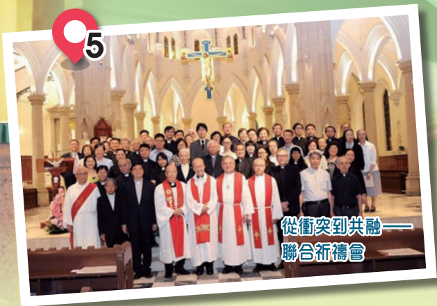
從衝突到共融—— 聯合祈禱會

及後在二零一七年十月三十一日，那正正是五百年前馬丁路德釘上九十五條的那個晚上，香港信義宗聯會和香港基督教協進會在灣仔伊利沙伯體育館一