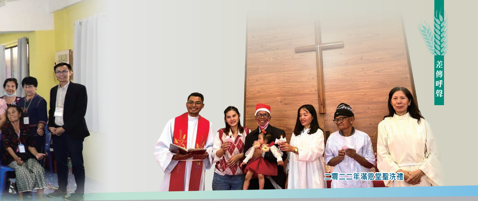
二零二二年滿恩堂聖洗禮