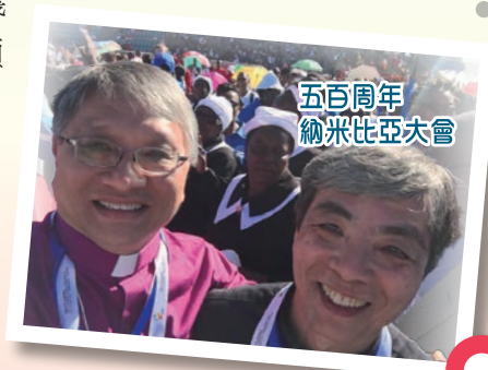
五百周年 納米比亞大會

World Federation, LWF）（下稱世信聯）選定了非洲的納米比亞舉行六年一次的大會，並同時舉行教會改革運動五百周年紀念崇拜，我亦有幸踏上這段路途，參加了這次大會和五百周年紀念崇拜。崇拜場地是一個