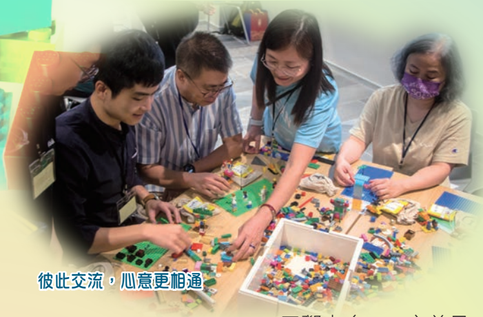
彼此交流，心意更相通

同路有你作伴，倆肩相緊靠， 願意彼此分擔倆扶持， 同路有你勉勵，倆心相呼應， 邁向標杆前行結伴去。 縱有阻礙，滿是泥濘，路滿荊棘阻去向， 是你結伴勉勵，一起跟我闖， 沿路有你結伴，我心得鼓舞， 路滿精彩，全憑有著你。 滿心感謝，有伴同行，路縱崎嶇不放棄， 是你結伴上路，一起多美好， 沿路有你結伴，我心得鼓舞， 路滿精彩，全憑有著你， 邁向標杆，昂然闊步去， 為你感恩，同行上路去。 ELCHK