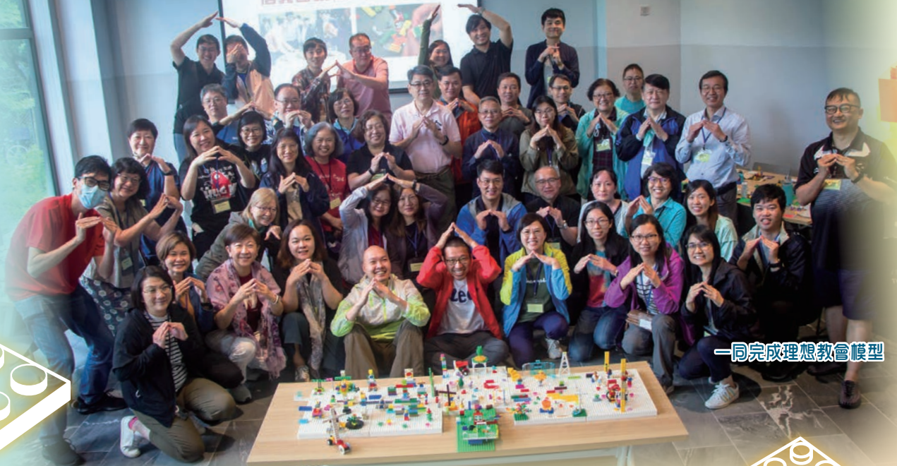
一同完成理想教會模型