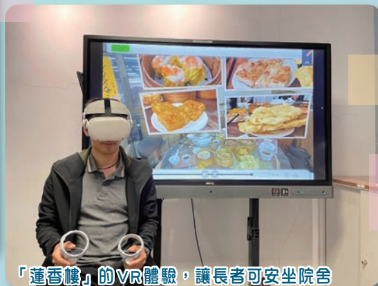
「蓮香樓」的VR體驗，讓長者可安坐院舍再次體驗去茶樓飲茶食點心。