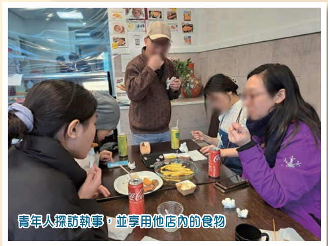
青年人探訪執事，並享用他店內的食物