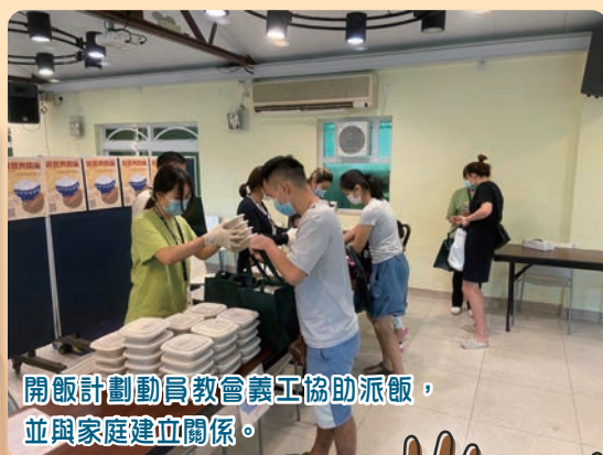
開飯計劃動員教會義工協助派飯，並與家庭建立關係。