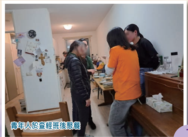
青年人於查經班後聚餐