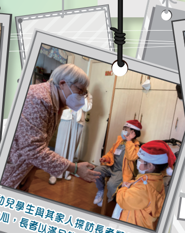
幼兒學生與其家人探訪長者鄰舍中心，長者以滿足笑容作回饋。