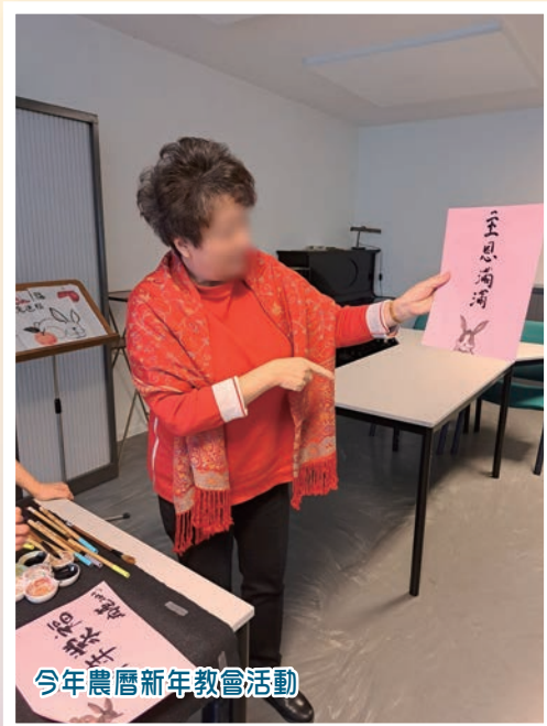
今年農曆新年教會活動