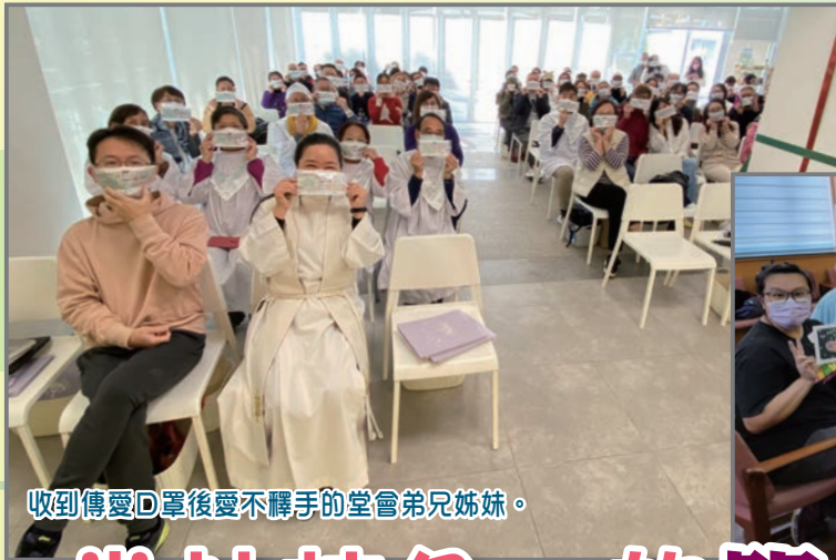
收到傳愛D罩後愛不釋手的堂會弟兄姊妹。