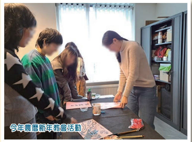
今年農曆新年教會活動

我們剛完成政府要求的荷蘭文考試，希望能順利過關，免被罰款，也可以更專心事奉。阿們。 ELCHK