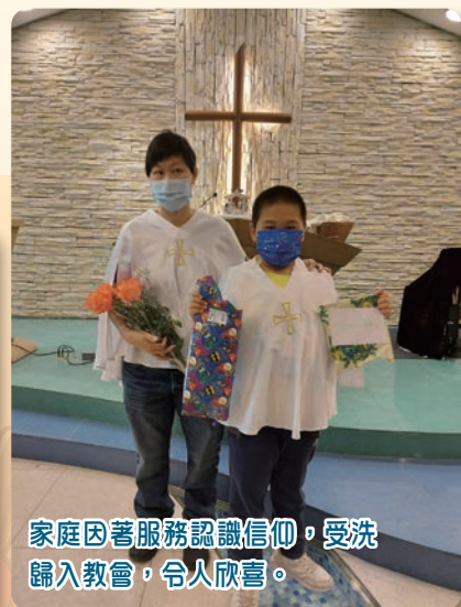
家庭因著服務認識信仰，受洗歸入教會，令人欣喜。