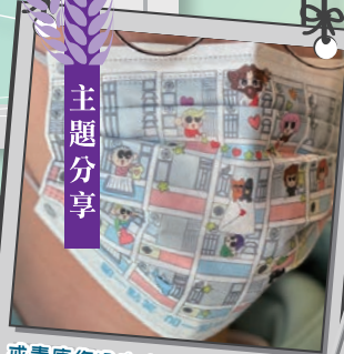
戒毒康復過來人設計的口罩，以屋邨作背景，鄰舍彼此傳遞愛。