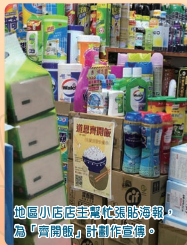
地區小店店主幫忙張貼海報，為「齊開飯」計劃作宣傳。

感謝上帝使用我們，讓我們能發揮堂社校合作的協同效應，透過創建服務窗口，不單回應社區家庭的身心需要，更重要的是帶領更多群體來到上帝面前，認識福音並得著救恩。當中更有家庭因此而參與信仰課程，整個家庭繼而受洗歸入教會，在教會成長，得著最美好的福分；亦有家庭由受助者轉化為助人者，參與開飯事工接待新加入的家庭。願上帝與我們同行，賜福我們手所作的工，結出更多堂社校合作的果子。 ELCHK