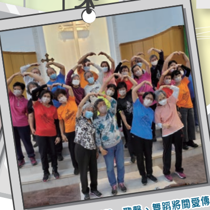
堂會弟兄姊妹用琴聲、歌聲、舞蹈將關愛傳給青年人，為他們打氣！