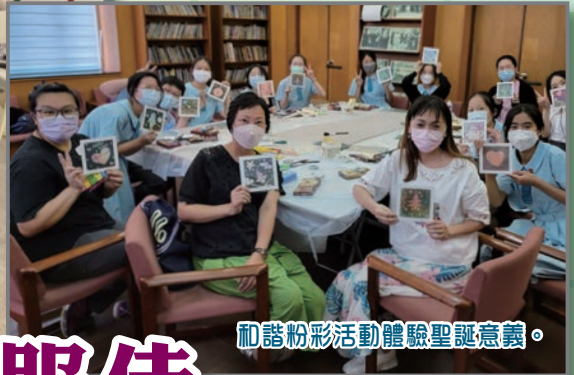
和諧粉彩活動體驗聖誕意義。