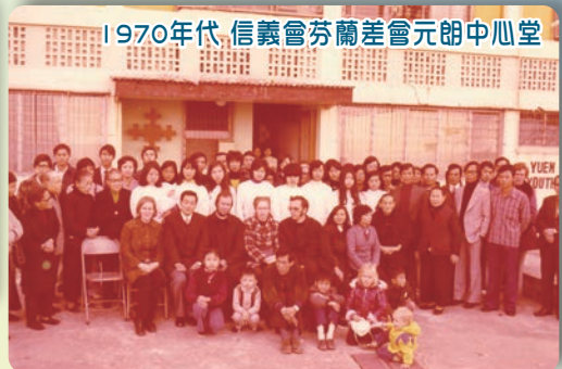
1970年代 信義會芬蘭差會元朗中心堂