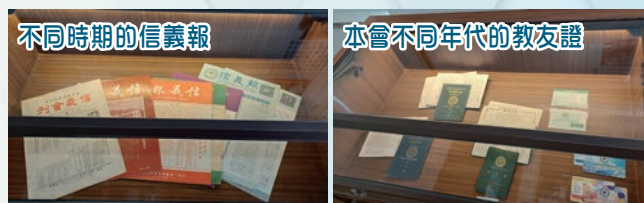
不同時期的信義報

「歷史資料閱覽室」的開幕，標誌著本會的承傳，感謝弟兄姊妹及同工的參與，常務委員會的撥款支持，總辦事處同事的努力，使歷史資料閱覽室事工得以順利開展。此後，亦非常需要大家繼續支持，如堂會歷史刊物捐贈，組織弟兄姊妹一同參觀及學習，使本會歷史資料更充實更完備，讓教會歷史及發展薪火相傳，榮耀上帝。（如欲查詢有關「歷史資料閱覽室」，請致電 2388-5847 聯絡總辦事處） ELCHK