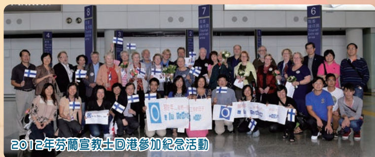
2012年芬蘭宣教士回港參加紀念活動