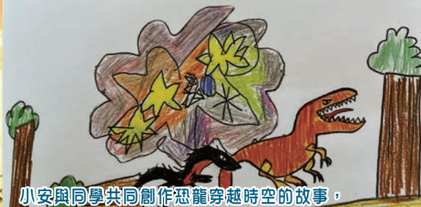
小安與同學共同創作恐龍穿越時空的故事，同一個故事包含幾個男孩喜歡的元素。

白堊紀時代，一隻暴龍遇到一隻暴虐迅猛龍，牠們為了表現自己是最強的恐龍，打起架來。