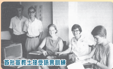
首批宣教士接受語言訓練

差會在香港的工作主要分為三類：堂會工作、服務工作及其他，然而服務工作必與傳道事工結合。堂會及服務單位以夥伴形式服務各區，簡述如下：