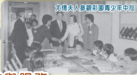
尤德夫人參觀彩園青少年中心