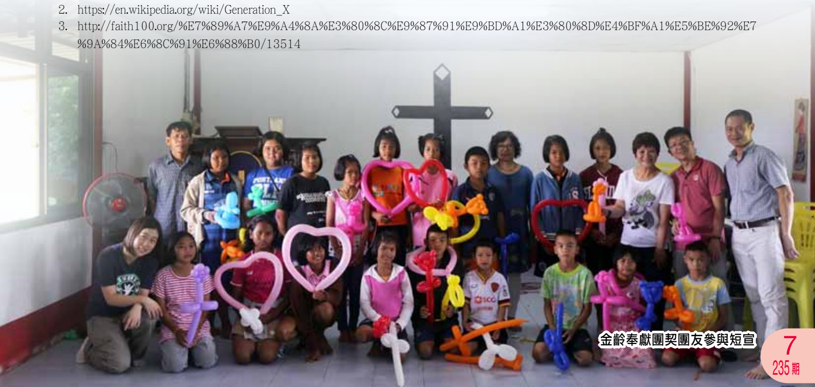
金齡奉獻團契團友參與短宣