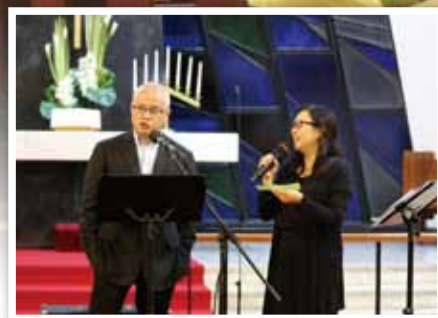
► 方承方副監督回答台下問題