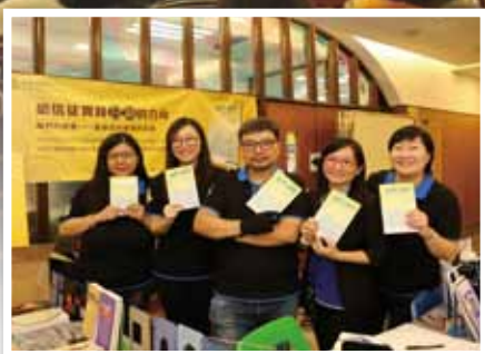
► 新書《我們的遠象》熱售