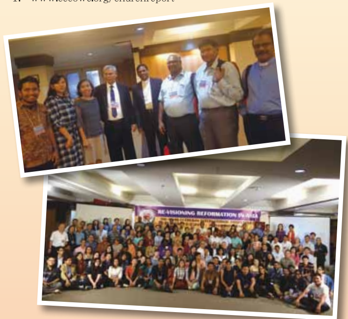
攝於：第九屆信義宗亞裔會議