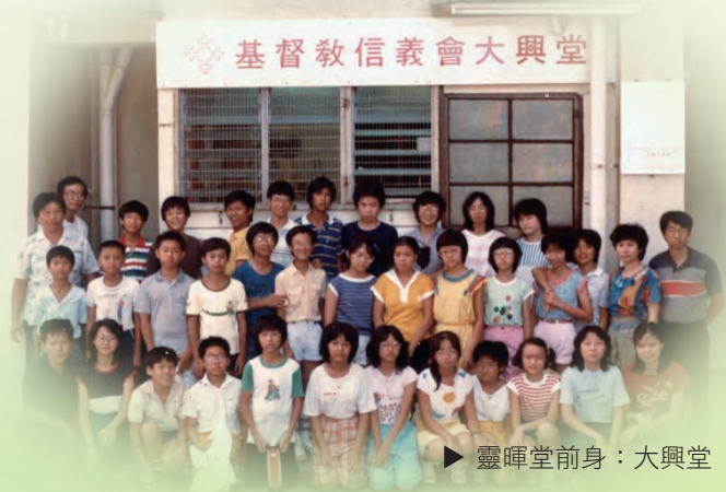
► 靈暉堂前身：大興堂

我們作為地上可見的教會，免不了受時、地、人的限制；然而，我們發現最大的限制就是自己的老我。何以突破？求主幫助！ ELCHK