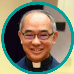
天主教香港教區副主教 陳志明神父