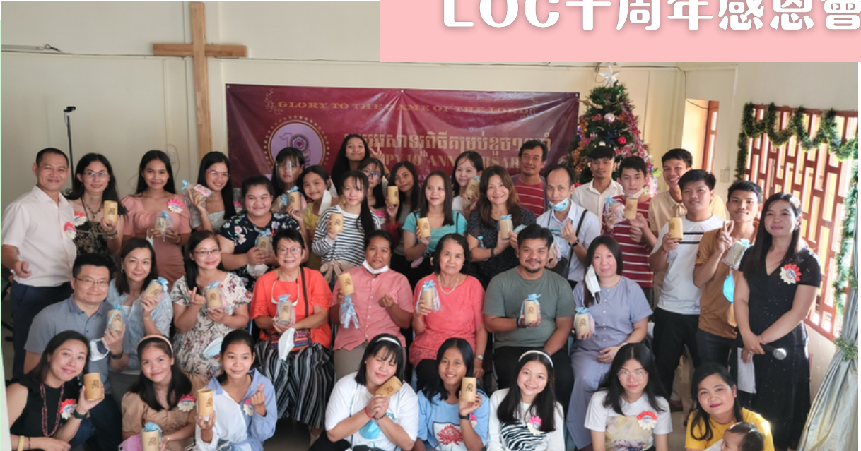
圖：《LOC十周年感恩會》已於12月12日與香港同步舉行。為過去十年主的帶領，歸榮耀予上主。(更多圖片在P.5)