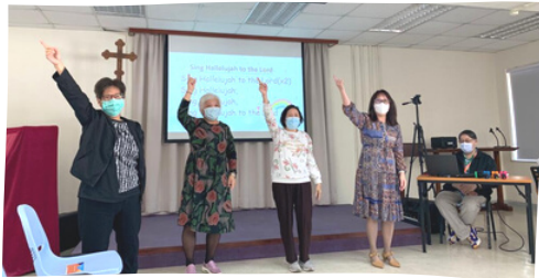
天恩堂姊妹們帶領感恩讚美