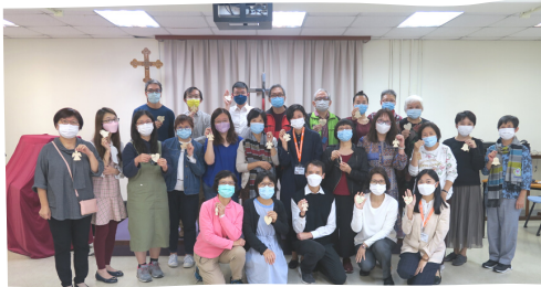
香港出席的弟兄姊妹大合照