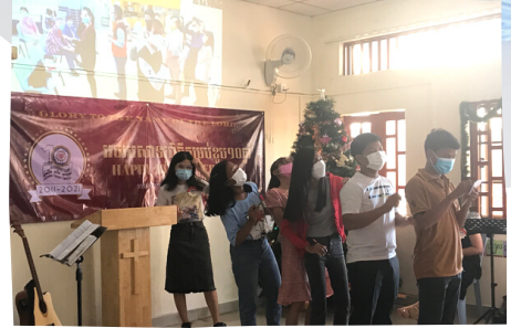
與香港進行線上遊戲