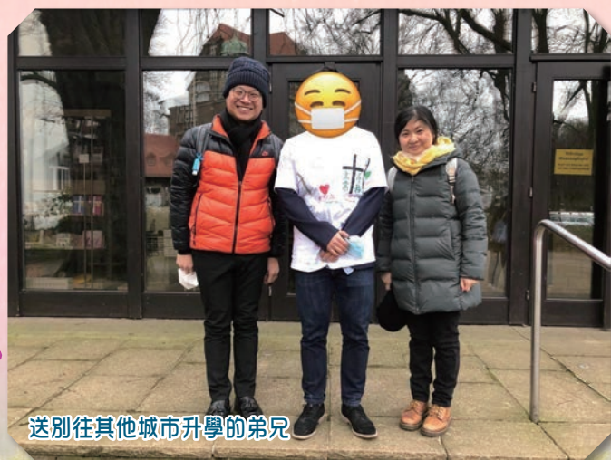
送別往其他城市升學的弟兄