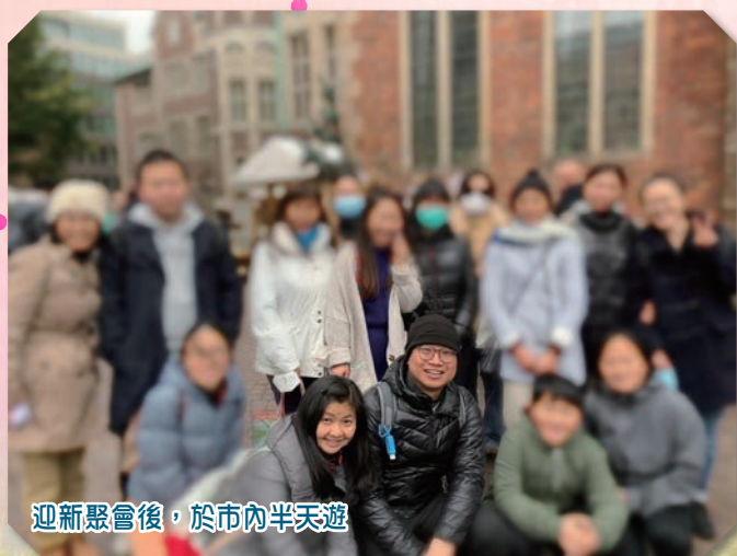
迎新聚會後，於市內半天遊