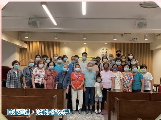
回港述職，於鴻恩堂分享

在疫情下，過去的新春聚會、迎新活動、中秋聚會、聖誕聚會，這種種以節日情懷，配合家鄉美食的活動，都無法舉行了。當一種以教會為中心，以吸引人「來」的宣教策略，因著疫情而無計可施的時候，我們更要著重「去」關懷人的宣教策略。我們在主日學中進行「關懷佈道訓練」，教導弟兄姊妹如何「去」有效佈道，要「去」到更多地方，開展更多新的查經班。