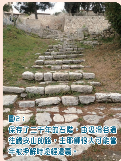
圖2：保存了三千年的石階，由汲淪谷通往錫安山的路，主耶穌很大可能當年被押解時途經這裏。

單單是這一段來回汲淪谷的部分便要花上半天，對很多聖地團的組織者來說，是非常奢侈的，同時也要花費不少體力才能完成。然而，當我們想全人投入感受主的受苦，單是頭腦的認知是不足的，原有的苦路也未必能滿足情感的代入。不少走過這段新苦路的團友的回應是，聽到也覺得累，但走在這一段路能更深入體會何謂受苦。ELCHK