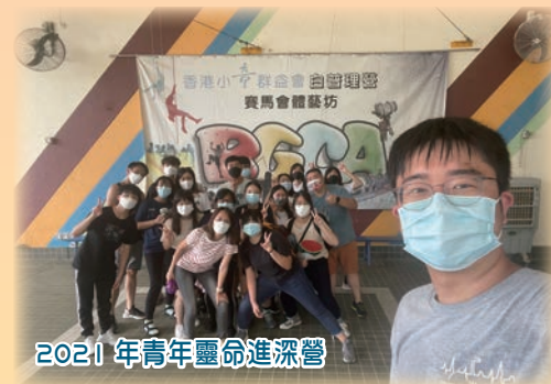
2021年青年靈命進深營