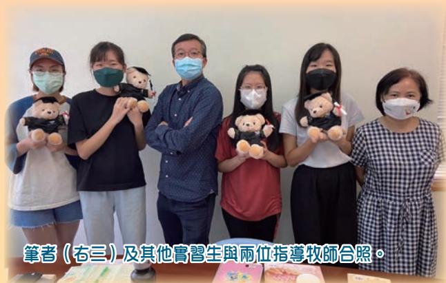
筆者（右三）及其他實習生與兩位指導牧師合照。

感謝主！讓我在這九個月經歷了很多磨練和塑造，青年全職實習計劃毫無疑問是我信仰路上一個很重要的轉捩點，讓我更認識自己，突破限制，與上帝更親近。這些經歷會成為我生命中重要的一部分，引領我繼續在生活中活出基督榜樣，為主作見證。