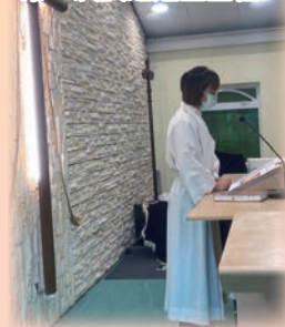
第一次於道恩堂主禮