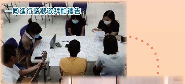
一同進行詩歌敬拜和禱告

在實習計劃中的得著、感受和經歷，三天三夜也說不完。願大家繼續為教會、青年信徒及個人的屬靈生命禱告。