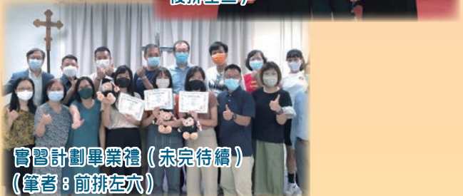
實習計劃畢業禮（未完待續） （筆者：前排左六）