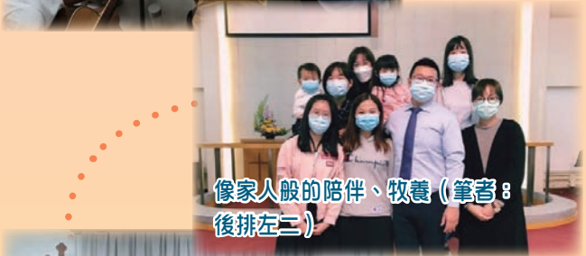
像家人般的陪伴、牧養（筆者：後排左三）