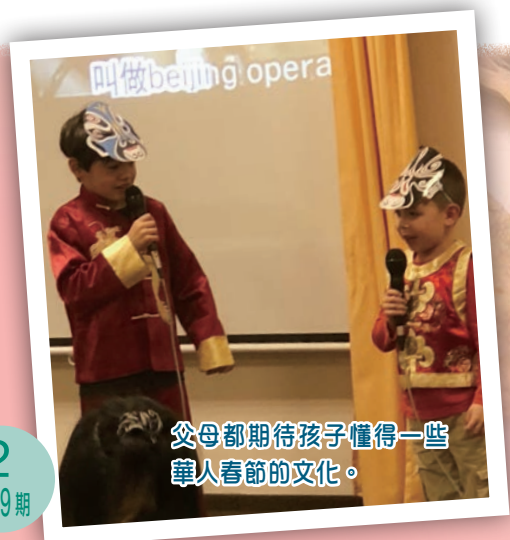
父母都期待孩子懂得一些 華人春節的文化。

慶幸我們在這裏服事華人，每個農曆新年教會舉辦慶祝活動，也是一項福音活動，以包餃子、春節表演來接觸新朋友。去年，我們也可初嘗北方的新年文化，學著人家包餃子（今年因疫情無法舉行了）。生活在外地，更體會到主內一家的真諦，主內的弟兄姊妹就是一家人，彼此照應，連繫著彼此的生活。其實在哪裏過節也好，最重要的是人與人之間能共聚、分享，這就是節日中最大的喜悅和滿足。 ELCHK