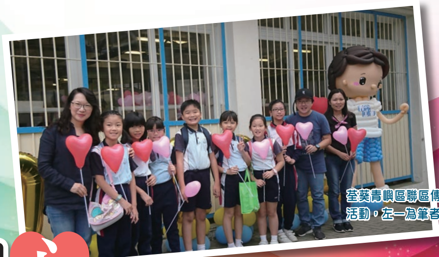
荃葵青嶼區聯區傳愛大步走活動，左一為筆者。