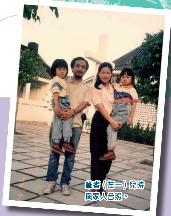
筆者(左一)兒時 與家人合照。

往英國修讀脊醫是我從前沒有想到的，我從小只知道要事奉天父上帝，要做傳道人。一路成長，尤其在修讀神學的時候，認識和思考更多不同的事奉和傳福音的方向。我相信於不同的階段和地方，天父都會使用我們。在香港事奉期間，我從不同的牧者、宣教士和弟兄姊妹身上學習了很多。幾年前有幸到東亞地區的一間孤兒院探訪，這孤兒院專收容一些有醫療需要和殘障的孤兒，他們大多是因為殘疾而被拋棄。在與這些孤兒相處時，天父告訴我，他們都是祂的寶貝。就在那時起，我開始思考服事這些寶貝的可能性。當我看到身體上有病患的人，我總想到主耶穌一邊傳道、一邊醫病。「耶穌走遍各城各鄉，在他們的會堂裏教導人，宣講天國的福音，又醫治各樣的病症。他看見一大群人，就憐憫他們；因為他們困苦無助，如同羊沒有牧人一樣。」(太九35-36)我希望除了傳道、牧養、祝福，為人帶來心靈醫治外，亦能帶來身體上的醫治。我想起兒時我常常祈求天父賜我醫治和行神蹟的能力，但現在祂以另一種方式回應我的禱告。