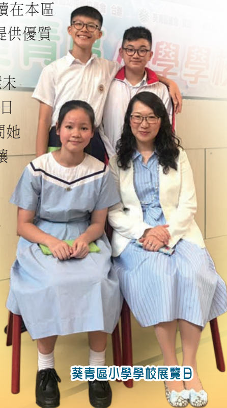
葵青區小學學校展覽日

以上故事其實還未完結：教授拜訪了昔日那位「好老師」，問她到底有何絕招，能讓這些在貧民窟長大的孩子每個都出人頭地？這位老師眼中閃著慈祥的光芒，帶著微笑回答說：「其實也沒有甚麼，因為我愛這些孩子。」 ELCHK