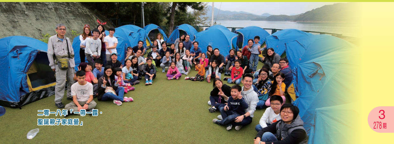
二零一八年「一帶一露」 聖誕親子家庭營」

「教養孩童走當行的道，就是到老他也不偏離。」（箴二十二6），與弟兄姊妹共勉。 ELCHK