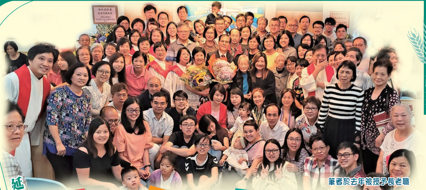
筆者於去年被授予長老職