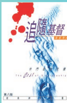
《追隨基督》 作者：潘霍華 出版：道聲出版社

我很喜歡潘牧師所寫的一篇詩，題目是「我是誰」，那是一篇充滿肉體與靈性爭戰的詩，很真實，也是每個人的寫照。人生在世，在難過時、感到被拋棄時、感到孤單時，在每一個負面情緒中，想得最多的就是生命的意義和自我的價值；而潘霍華牧師的答案卻令我最有共鳴：「我是誰？他們嘲笑我這憂鬱的問題。上帝啊，你知道我是誰，我是祢的！我是祢的人。」 ELCHK