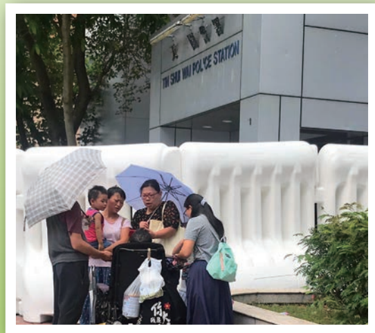
教會弟兄姊妹到示威衝突地方行區祈禱

作為牧者，或許眼淚也流過了，催淚彈也吃過了，痛罵也受過了，但不要因此而氣憤失望，因為對比耶穌基督，我們作的是算不得甚麼吧！就讓我們一起繼續以基督的福音守護我們的群羊，守住我們的信仰和教會，守望我們的香港！ ELCHK