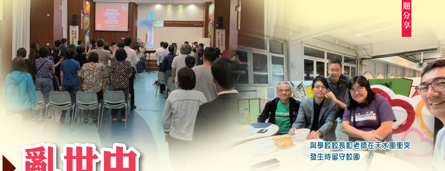
與學校校長和老師在天水圍衝突發生時留守校園