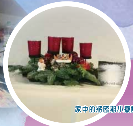
家中的將臨期小擺設