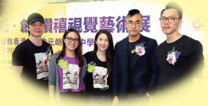
「元·創」元信鑽禧視藝展開幕禮 (攝於二零一八年十一月二十四日)