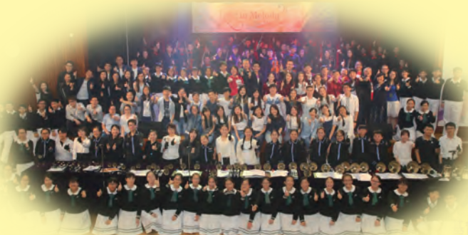
鑽禧校慶「愛·音·樂」妙韻知音匯 (攝於二零一九年五月十一日)