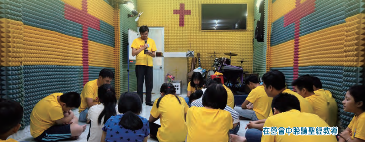
在營會中聆聽聖經教導

新接觸的家庭亦因教會地點改變而離開。有見及此，近來教會計劃購堂，價錢為美金二十五萬，希望穩定的聚會點能吸引慕道者和發展聖工，呼籲大家以禱告及奉獻支持當地的福音工作。