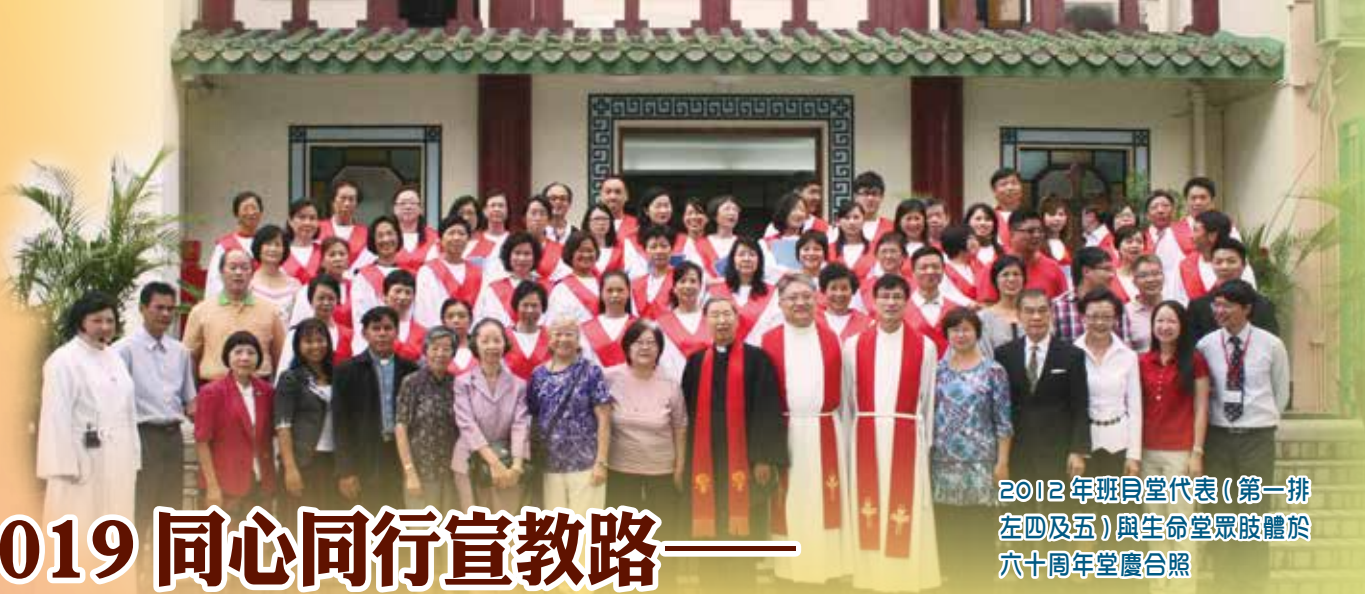
2012年班貝堂代表(第一排左四及五)與生命堂眾肢體於六十周年堂慶合照