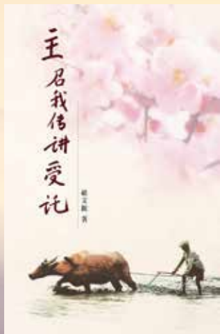
祖牧師著作—— 主召我傳講受託