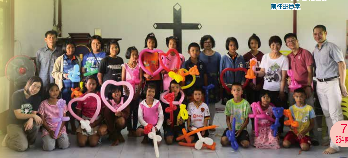
2016 年泰國短宣隊 前往班貝堂

華人教會與信徒從主領受極大的恩典，我們期望看見更多堂會加入這宣教伙伴的合作行列，因為上帝應許：凡有的，還要加給他。這個蒙福之旅，你願意陪我們一起走嗎？ ELCHK