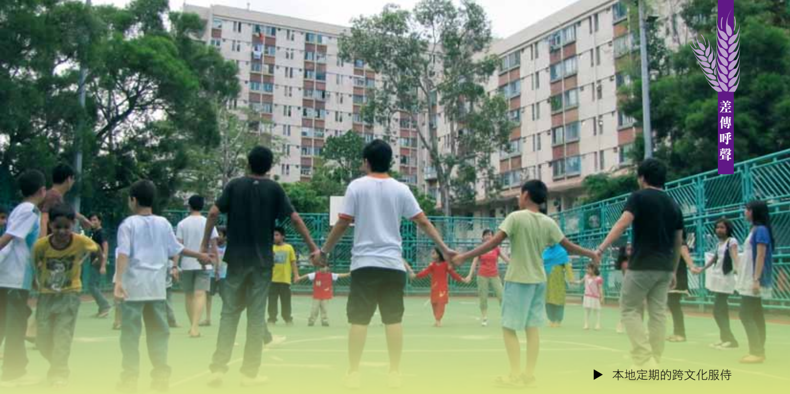
► 本地定期的跨文化服侍