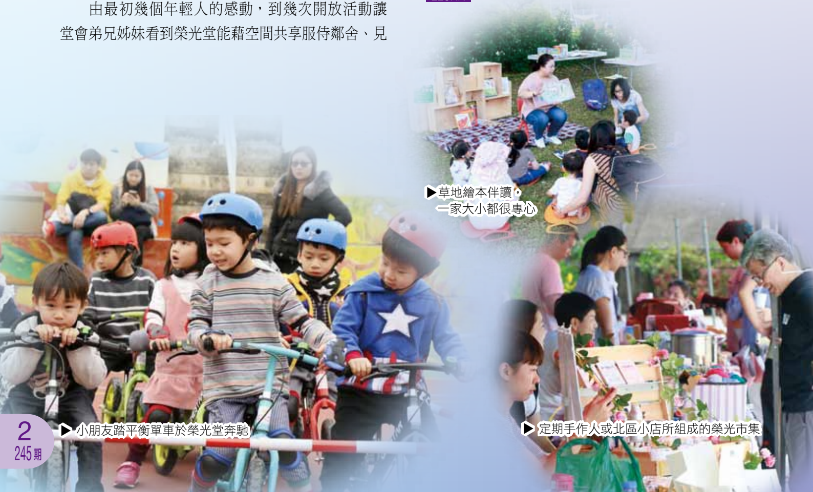
▶ 草地繪本伴讀，一家大小都很專心