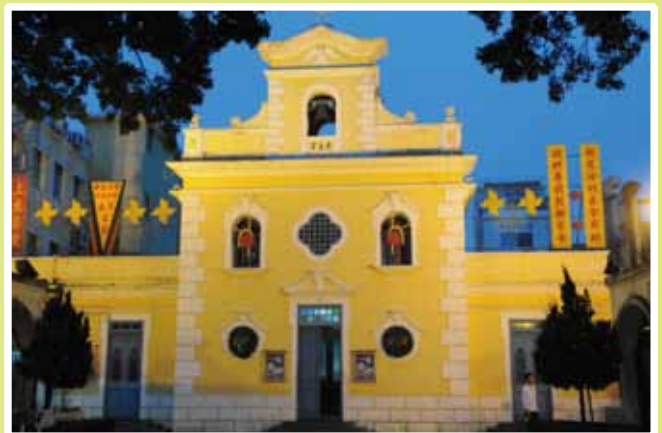
► 在訪宣中進入天主堂，教導短宣員學習宣教士腳蹤的歷史。

筆者真心地期待香港教會和普世華人教會，可以更加委身在宣教工作上，或者更關注實踐「大使命」，結合差傳與門徒訓練，教會更加復興，以致對福音使命有更大的承擔，「使萬民作主的門徒」，深信「凡有的，還要給他，讓他有餘；凡沒有的，連他所有的也要奪去。」（太十三 12） ELCHK