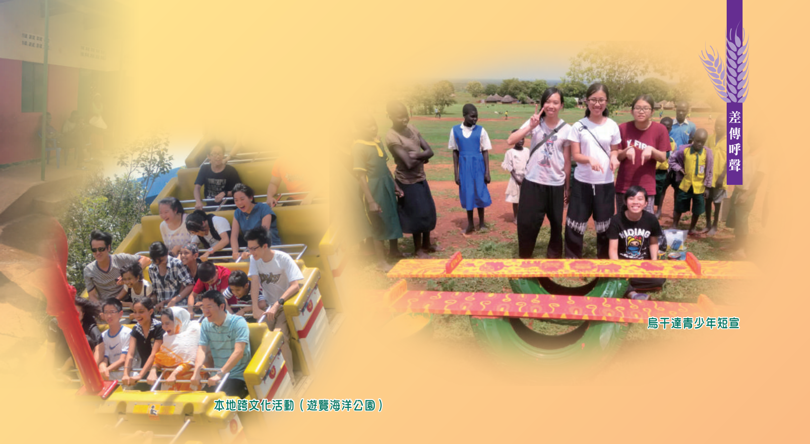
本地跨文化活動（遊覽海洋公園）