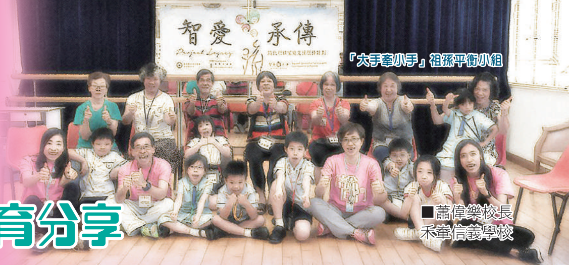
「大手牽小手」祖孫平衡小組