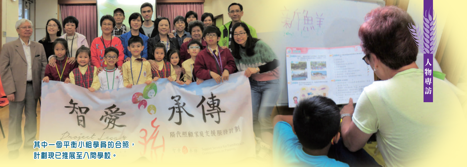
其中一個平衡小組學員的合照，計劃現已推展至八間學校。