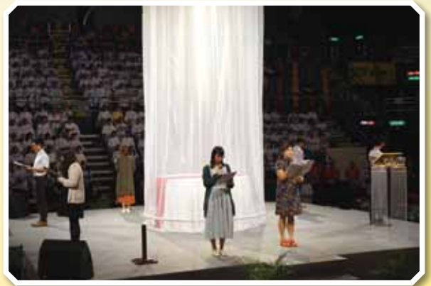
朗讀《九十五條論綱》