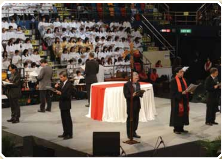
八位來自不同教會的代表代禱