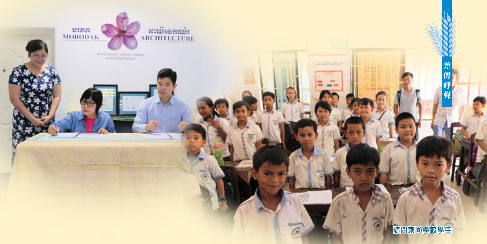
訪問東國學校學生

深覺能代表海宣出席是次儀式，是具有里程碑式的意義！感謝上帝的帶領，祈求上主繼續帶領整個柬埔寨建校工程，讓當地學生得著優質的教育和天國的救贖。