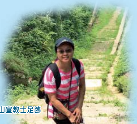
雞公山宣教士足跡