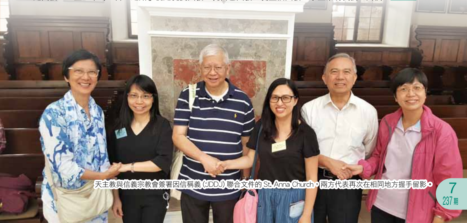
天主教與信義宗教會簽署因信稱義（JDDJ）聯合文件的 St. Anna Church，兩方代表再次在相同地方握手留影。

要達到各宗派同領聖餐的合一之路，雖然很遙遠，但生活上彼此相愛的合一之路卻近在咫尺。讓人知道我們是同信三一主上帝的「合一之路」就是從愛出發、從自己出發、從生活出發。求主幫助我們，阿們！ ELCHK