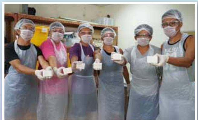
阿奇與靈愛弟兄合力製作的手工規

* 清心規是靈愛中心及天朗中心接受服務的戒毒學員所生產的手工規產品，名字取自聖經馬太福音——「清心的人有福了」，計劃希望透過製作及銷售清心規，成為別人的祝福；也警惕戒毒學員突破「番規」（諧音：「返繭」，俚語：再次入獄）的迷思。